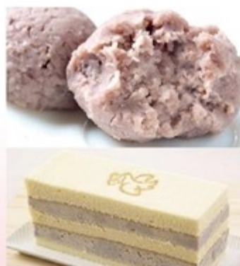
連珍母親甜品組 售價355元 芋泥雙層蛋糕1條+芋泥球2盒 保存期限：冷藏4天