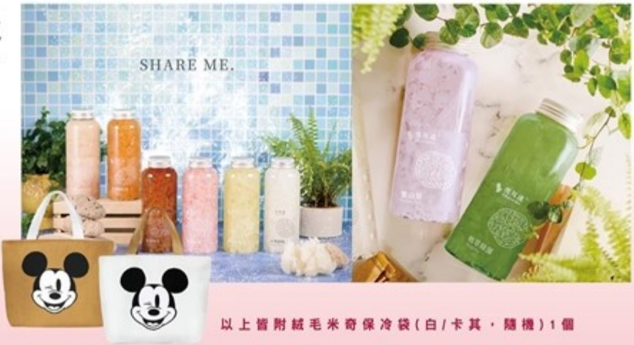
以上皆附絨毛米奇保冷袋(白/卡其，隨機)1個

米奇輕禮組 限量 售價 850元 (原價) 經典原味(420mlx6入) 售價 900元 (綜合) 綜合口味(420mlx6入) 原味/玫瑰/烏龍/紅茶/奶茶/咖啡 保存期限：冷藏14天 米奇豪華組 售價 950元 (原價) 經典原味(420mlx8入) 售價 1000元 (綜合) 綜合口味(420mlx8入) 原味/玫瑰/烏龍/紅茶/奶茶/咖啡/綠藻(新品)/紫山藥(新品) 保存期限：冷藏14天