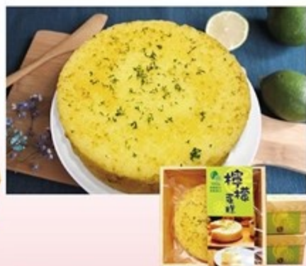
母親節甜蜜檸檬蛋糕 售價300元 / 204g 保存期限：常溫5天