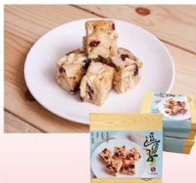
連珍逗果子 售價300元 一盒20個 保存期限：常溫15天