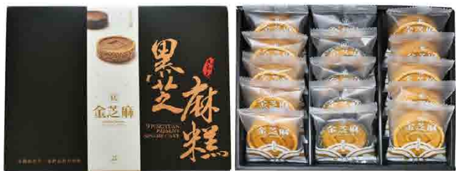
金芝麻糕禮盒 / 15入 售價 500元