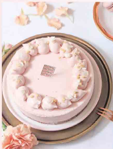
美麗好氣色/6吋 覆盆子巧克力慕斯蛋糕 售價780元 遠百獨家優惠價 成份：法國諾曼地乳源天然奶油、法國布列塔尼乳源乳酪、法國覆盆子果泥、100%可可粉、COCOABARRY 29%白巧克力 清輕美的覆盆子白巧克力慕斯，藏著酸甜華麗莓果及香甜可可蛋糕，外層佐上法國乳酪覆盆子，層次豐富交錯，給媽媽美顏好氣色！

Happy mother's day Mom makes life beautiful