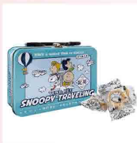
英記Snoopy 迷你粒粒杏仁餅 售價389元 規格：120g公克/盒 保存期限：常溫1年

【澳門英記餅家 Pastelaria Yeng Kee】創始於1928年，是澳門最具代表性的老牌餅家之一。不僅伴陪無數澳門人成長，更是備受歡迎的澳門手信，深情厚禮，心思滿載，正是澳門英記九十多年不變的。