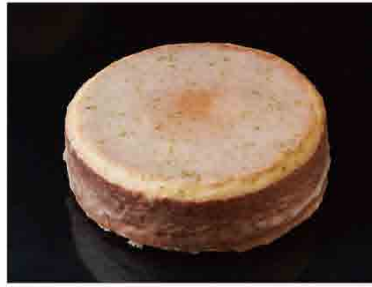
戀的檸檬糖霜蛋糕 售價580元/6吋 保存期限：冷藏4天