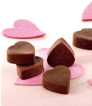
巧克力鳳梨酥 售價350元/8入 規格：200公克/盒 保存期限：常溫40天

我們當初抱持的開發理念是：希望能藉由每一項產品附於其獨特性來傳達一份人與人之間的「關懷」和「情意」。