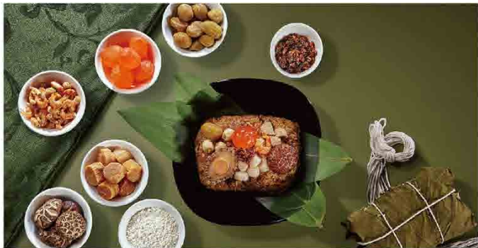
阿一傳人 港式XO醬鮑魚干貝裹蒸粽 售價1080元 遠百獨家