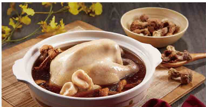
阿一傳人 鮑魚姬松茸雞湯 原價990元 特價890元 遠百獨家