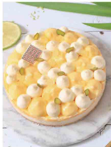
輕檸乳酪蛋糕 售價780元/6吋 成份：法國布列塔尼乳源乳酪、法國諾曼地乳源天然奶油、法國諾曼地乳源天然鮮奶油、新鮮檸檬。 選用質地綿密細緻的法國進口乳酪，帶入新鮮檸檬的清香及酥脆底層，法式的乳酪輕柔化口，獻給喜愛純粹美好滋味的媽媽們！