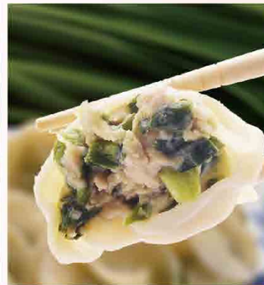
韭菜鮮肉水餃/24入 原價180元 特價160元 保存期限：冷凍6個月