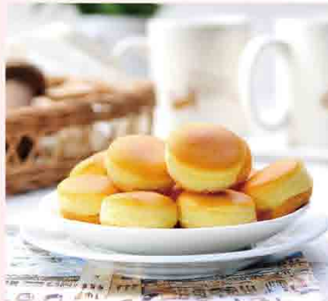
原味乳酪球/295g 售價270元 保存期限：7天

創業超過70年以上的大溪糕餅老店，融合新的西式點心與傳統中式糕餅，堅持嚴選材料，秉持著對烘焙的熱忱，給您美味與健康。