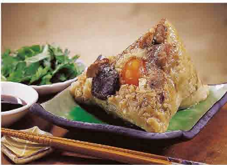
品香南部粽 售價460元

「品香肉粽」創立於1983年，除了蟬聯2009、2010、2011、2012年城10大傳統美食、2011~2012台南百家好店、台灣尚青台灣肉粽王比賽冠軍外，更獲邀參加台北花博台灣美食示範區展售等殊榮。