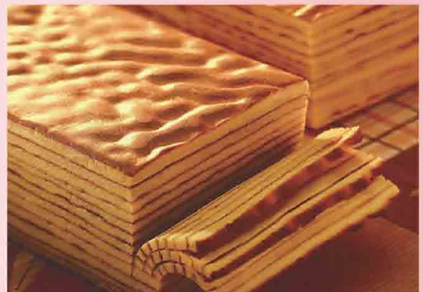
荷蘭貴族手工蛋糕/1入 售價320元 保存期限：冷藏5-10天