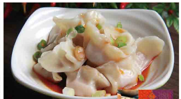
紅油水餃/30入 售價270元 保存期限：冷凍6個月