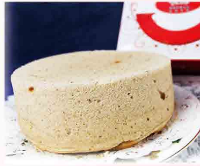
伯爵紅茶蛋糕8吋 售價150元 保存期限：冷凍7天