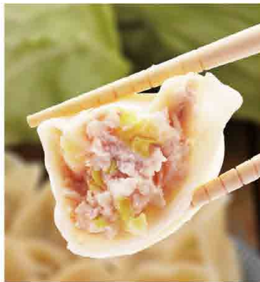
高麗菜鮮肉水餃/24入 原價180元 特價160元 保存期限：冷凍6個月

台北市東門市場知名老店！ 純手工水餃 獲2017蘋果日報年菜評比冠軍 純手工獅子頭 獲2018蘋果日報年菜評比冠軍