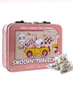
英記Snoopy 原味牛軋糖 售價429元 規格：120g公克/盒 保存期限：常溫6個月