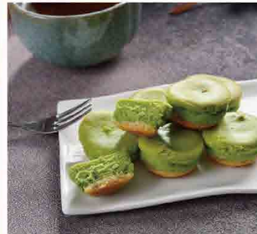
抹茶乳酪球/295g 售價280元 保存期限：7天

年銷300萬顆黃金乳酪球，上層香濃乳酪配上下層起司餅乾，形成絕妙雙層口感，咬下的瞬間能品嚐到香醇奶香，甜而不膩，讓您愛不釋手。