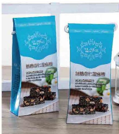
無糖杏仁芝麻糖 售價 250元

致力研發低血糖值、低熱量、無麩質過敏源，不添加人工香料色素，並選用地新鮮水果、米糠來製成健康兼具美味的烘焙精品。