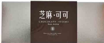
芝麻·可可 / 9入 售價 400元