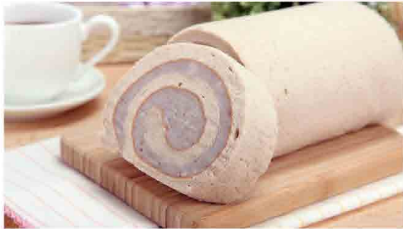
芋香捲 售價360元1入 規格：850g 保存期限：冷藏4天

用真心做最好-香帥蛋糕所提供的每一條蛋糕看似簡單，卻保有三十年的堅持，師傅們用心琢磨每一個製作步驟，就像做給家人、給自己享用一般，要讓消費者能吃得既開心又安心。