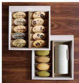
山木實花/1入 售價 910 元