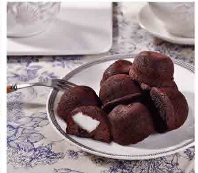
QQ布朗尼/250g 售價200元 保存期限：7天

抹茶控的最愛來了！每顆乳酪球讓您在香濃乳酪中吃出抹茶清香，上層重乳酪抹茶蛋糕配上下層起司餅乾，多種層次一次擁有！