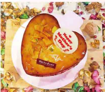
愛莉絲百香芒果磅蛋糕(蛋奶素) 售價350元/390g±5% 內容：百香果、芒果乾、白葡萄酒 保存期限：冷藏5天