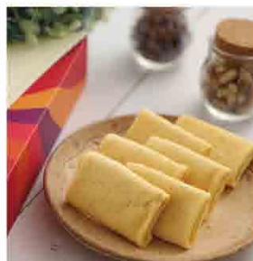
英記手工鳳梨捲 售價269元 規格：120g公克/盒 保存期限：常溫4個月