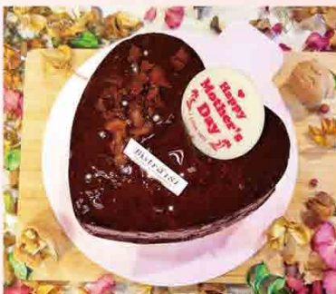
微笑貓無花果可可磅蛋糕(蛋奶素) 售價330元/390g±5% 內容：巧克力豆、蜂蜜、紅酒釀無花果 保存期限：冷藏5天