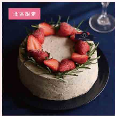
北區限定 唐寧伯爵茶蛋糕/6吋 售價990元 保存方式：冷藏3-5度 保存期限：5天