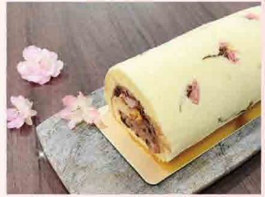
櫻花生乳捲 售價500元/條 保存期限：冷藏7天

選用日本八重櫻跟梅子醃漬，帶出令人難外的酸鹹獨特滋味。內餡紅豆生乳餡與軟Q的白玉麻糬完美結合。