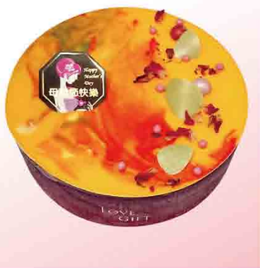
冰淇淋蛋糕 售價1199元 規格：6吋 保存期限：冷凍1個月 成分：牛奶、砂糖、鮮奶油等 (蜂蜜/柳橙、百香果)

以德國製作冰淇淋的傳統手工做法，運用德式精神(濃郁牛奶香,嚴選新鮮食材)方式，不使用現成醬料及冰淇淋粉的做法，採用台灣當季最新鮮與世界各地直送來台的食材，搭配頂級鮮奶及德國原裝進口材料，並將糖度調合成台灣人喜歡的清甜，用心作出滑順與濃郁口感的皇家級冰淇淋。