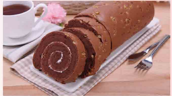
富士巧捲 售價260元1入 規格：650g 保存期限：冷藏4天