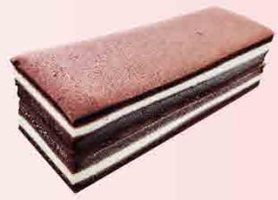
黑美人乳酪蛋糕一條 售價300元 保存期限：冷凍7天