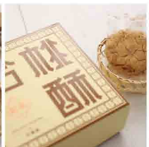
英記合桃酥 售價259元 規格：130g公克/盒 保存期限：常溫5個月