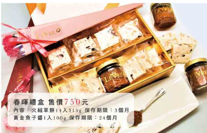
春暉禮盒 售價 750 元

感恩從感謝母親開始，樂福賀法式糕點，甜心戀人、 暖心甜口，以最用心製作的產品，獻給所有最偉大的母親。