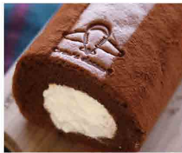
松露巧克力鮮乳卷/1卷 售價450元 規格：16*11*10公分 保存期限：冷藏5天 比利時70.4%微苦生巧克力夾層，清爽香醇的法國鮮乳內餡，享受巧克力在嘴裡慢慢融化的美妙滋味！