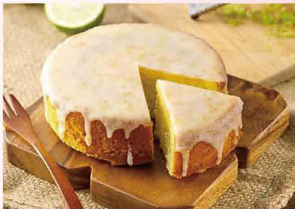
法國鄉村手作檸檬蛋糕/6吋 售價450元 保存期限：冷藏4-8天