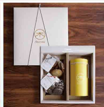
山木粹青B/1盒 售價 540 元