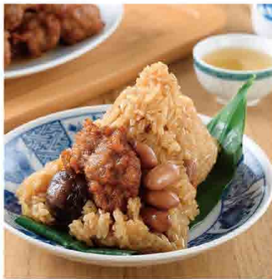
排骨酥肉粽 售價495元