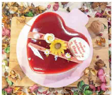
紅心皇后莓慕斯 售價650元 內容：草莓、覆盆子、奇亞籽、奶油乳酪、吉利丁、可可/500g±5% 保存期限：冷藏3日，冷凍7日

Bistro181 法式烘焙 是獨特法國麥香的硬法麵包品牌，嚴選進口法國麵粉與天然奶油，秉持健康/天然/無添加的理念，致力於用多種創意風味呈現不同法式烘焙品。