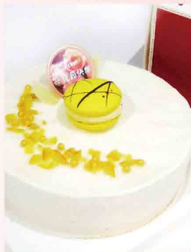
法式凍檸慕斯蛋糕 售價999元 規格：6吋 保存期限：冷凍1個月