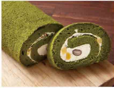
抹茶栗子紅豆生乳捲 售價480元/條 保存期限：冷凍7天