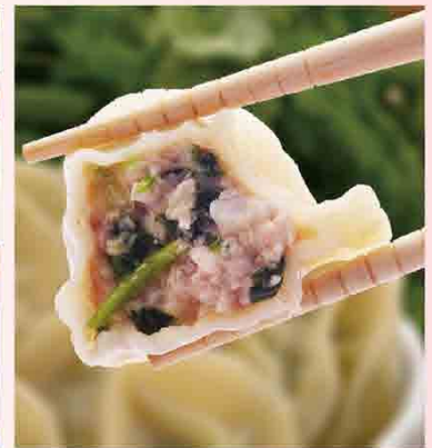
香菜鮮肉水餃/24入 原價180元 特價160元 保存期限：冷凍6個月