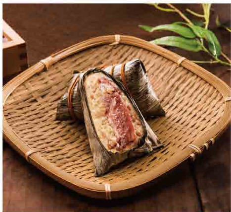
九如商號 湖州鮮肉粽 售價420元 規格：190g x 5入 包裝形式：禮盒 保存期限：冷凍180天

道地江浙名店，飄香一甲子，以用料扎實，講究手工著名，對於口味的堅持及要求，讓你不僅能回味傳統，也能品嚐現代風味。