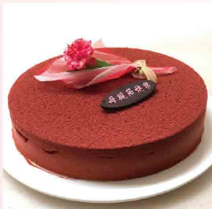
圓融蛋糕(8吋) 售價950元 保存期限：冷凍7天

電視媒體介紹：東森綜合台/中天綜合台/東森綜合台/食尚玩家/三立電視台-美食大三通 平面媒體介紹：自由時報/中國時報/聯合報/蘋果日報