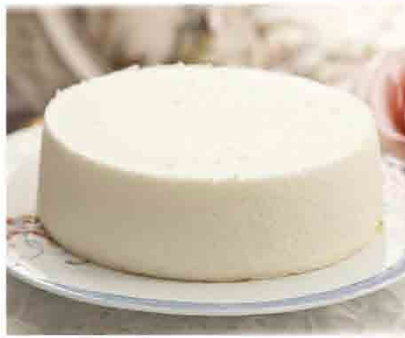
招牌檸檬天使蛋糕8吋 售價150元 保存期限：冷凍7天

採用新鮮蛋白，少許麵粉與水果餡，純手工製作。健康蛋糕不使用蛋黃、奶油、防腐劑，僅用些許糖及植物油，講求新鮮每日早上製作當日訂單，口感水嫩綿密，帶點水果清香，為團購商品熱門暢銷蛋糕。