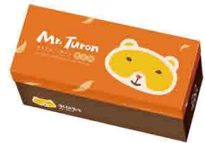
生乳麻糬燒/5入(原味、抹茶、巧克力) 售價240元 保存期限：冷凍10天

花蓮在地銅板美食，下午茶必備。使用花蓮南坑牧草放山土雞蛋製成的日式蛋糕，內餡夾進綿密滑順的瑪斯卡彭生乳起司餡，中間在放上一顆香濃黑糖麻糬，多層次的口感讓人忍不住一口接一口，一口滿足3種滋味的享受，還有巧克力抹茶三種口味可挑選喔！