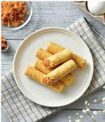
青鳥旅行 - 肉鬆蛋捲典雅禮盒