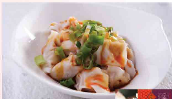
紅油抄手/30入 售價270元 保存期限：冷凍6個月