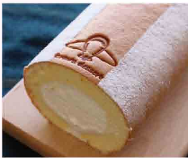
諾曼第鮮乳卷/1卷 售價360元 規格：16*11*10公分 保存期限：冷藏5天 清爽香醇的鮮乳內餡搭配有機雞蛋製成的戚風蛋糕，濕潤滑順、無負擔，炎熱天氣就是要純粹鮮奶這一味。